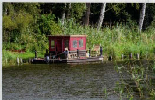
Die Idee mit dem Camping auf dem Wasser hat einfach Charme – das sehen wohl auch andere so.