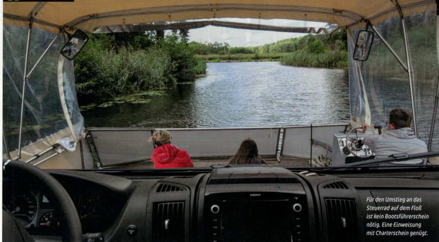
Für den Umstieg an das Steuerrad auf dem Floß ist kein Bootsführerschein nötig. Eine Einweisung mit Charterschein genügt.