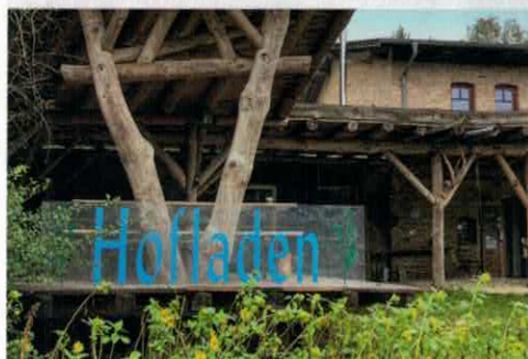
Die Ziegenkäserei Capriolenhof liegt an der Schleuse Regow. Im Laden gibt es auch Eis aus Ziegenmilch.