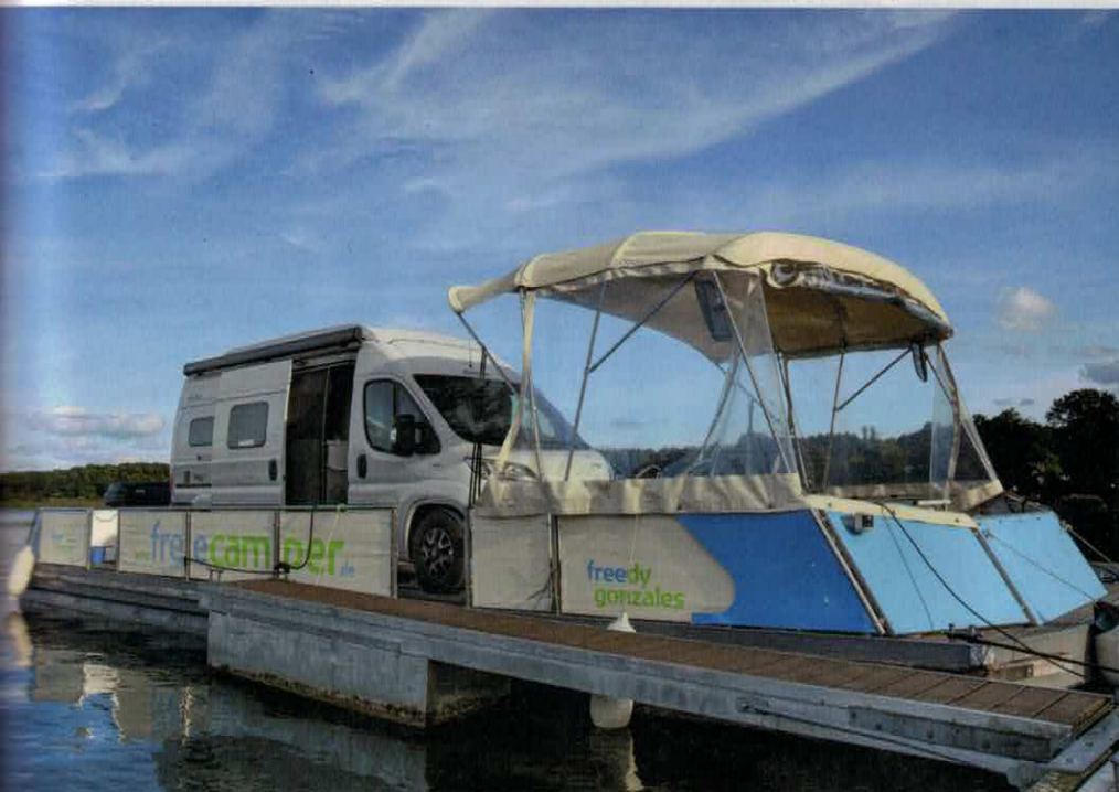
Die Anlegemanöver werden für uns schnell zur Routine. In den Yachthäfen gibt es wie auf dem Campingplatz Duschen und Toiletten. Reservierungen sind hier nicht üblich, aber es findet sich in aller Regel noch ein Platz.

Ringslebenerstraße 2, 16798 Fürstenberg OT Tornow, Telefon 0176/39 05 83 83 www.campingplatz-am-grossen-wentowsee.de Rund 15 Kilometer weiter weg, wendet sich dieser Platz an Ruhesuchende ab 14 Jahren.