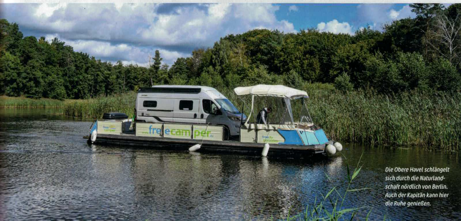
Die Obere Havel schlängelt sich durch die Naturlandschaft nördlich von Berlin. Auch der Kapitän kann hier die Ruhe genießen.