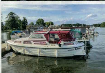
Statt Campingplätze steuern wir nun Yachthäfen an, wie hier in der Wasserstadt Fürstenberg/Havel.

per-Floß klar zum Ablegen. Dann wird es ernst: Bei der Einweisung unseres künftigen Kapitäns werden Vor- und Rückwärtsfahren geübt und der Einsatz des Seitenstrahlruders, hilfreich beim An- und Ablegen. Wer keinen Sportbootführerschein Binnen hat, bekommt nach einem mehrstündigen Theorie- und Praxistraining eine Charterbescheinigung.