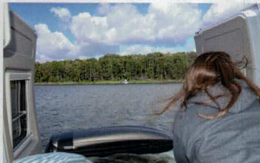
Durch die geöffneten Hecktüren hat man schon beim Aufstehen einen tollen Panoramablick.