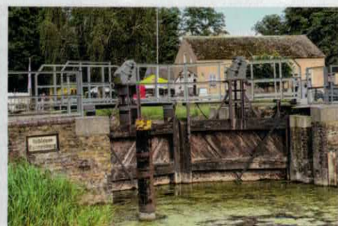
Hier endet ein Abstecher mit dem Freecamper. Die Schleuse Kannenburg wird gerade renoviert.

Teile der Umgebung gehören zum Naturpark Stechlin-Ruppiner Land, so auch der besonders idyllische Havelabschnitt zwischen Burgwall und Stolpsee. Auf fast 30 Kilometern schlängelt sich die Havel vor uns durch eine kaum besiedelte Naturlandschaft. Buchenwälder und Seen mit besonders klarem Wasser, das sind die Besonderheiten des Schutzgebietes. Neben den ausgedehnten Wäldern gib es 150 Seen im Naturpark, darunter die selten gewordenen Klarwasserseen, die besonders nährstoffarm sind. Der bedeutendste ist der Große Stechlinsee mit einer Maximaltiefe von 69 Metern.