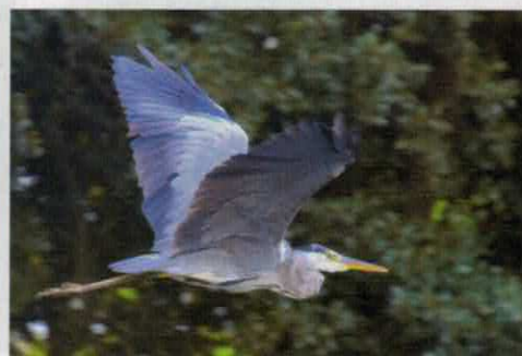
Der Naturpark Stechlin-Ruppiner Land ist ein Rückzugsort für zahlreiche Vogelarten wie beispielsweise Reiher.