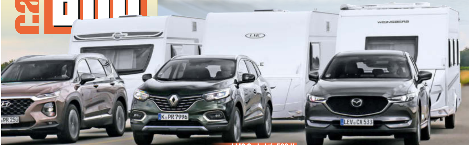
Bürostner Averso Plus 520 TL

MINK MIT DEFENDER Diese zwei kommen überall durch